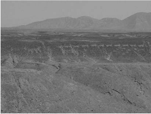
Figura 7. Caravana quebrada de Los Pintados – Región Tarapacá.

Broken caravan of The Identical ones – Region Tarapacá.