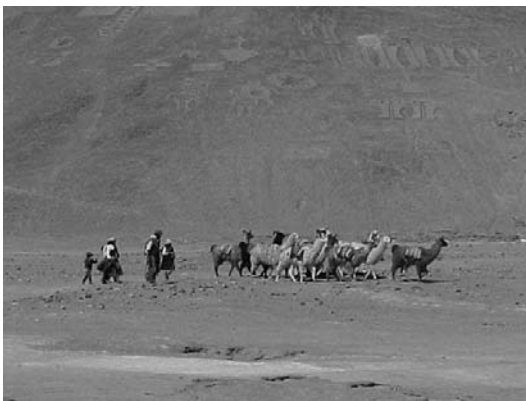
Figura 2. Recreación de caravana pasando por Cerros Pintados – 2000, Senderos Alto Sierra Tarapacá – Región Tarapacá.

Image of landscape: “Water eye” Puquio Núñez – Commune of Pica.