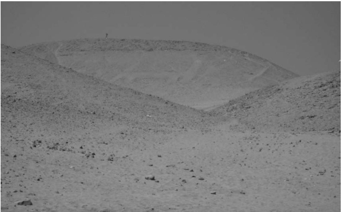
Figura 8. Figura de Llama aislada. Cerro Sombrero – provincia de Arica.

13. Que existe un hilo conductor que enlaza y une todos los sitios con geoglifos, como también algunos sitios con petroglifos, que se localizan en el desierto. Me refiero a los senderos , que lo cruzan en todos los sentidos. Estos se conectan con los vados de los disminuidos cauces de los ríos locales , las aguadas , ojos de agua , vertientes , pozos , puquios