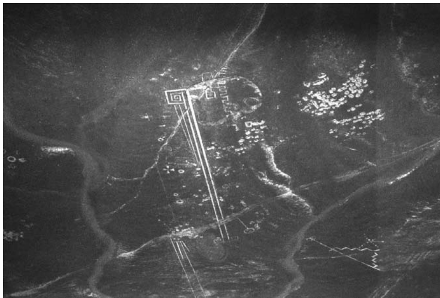
Figura 5. Sitio con geoglifos. Alto Ariquilda norte – provincia del Tamarugal. I surround with geoglifos; High Ariquilda Norte – Province of the Tamarugal.