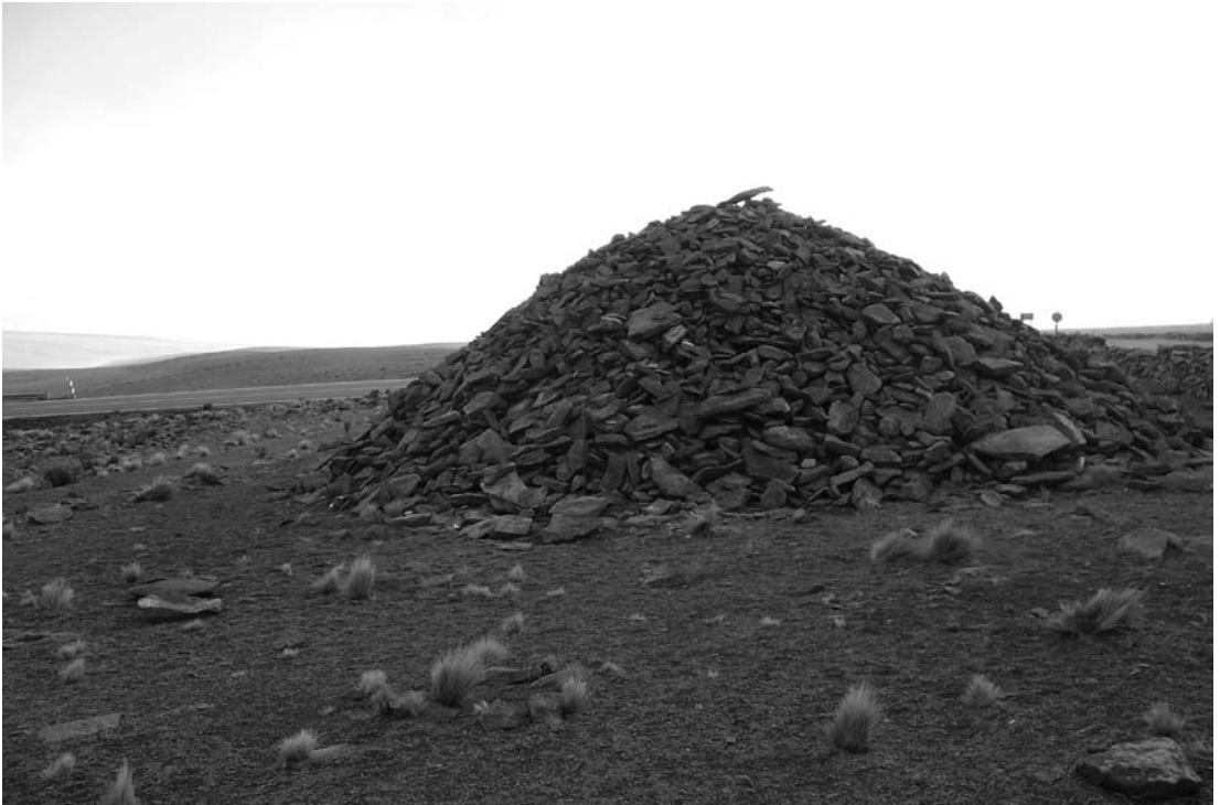
Figura 9. Apacheta. Mama Apacheta Salar de Huasco – Comuna de Pica. Pile: It(He,She) sucks Pile Salar of Huasco – commune of Pike.