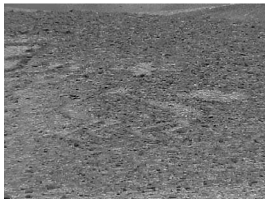
Figura 3. Imagen de “relación sexual”; cerro Mono – provincia del Tamarugal.

5. Que los geoglifos son expresiones ideográficas que permitieron al o los autores manifestarse realista y simbólicamente, reproduciendo y modificando diseños ya conocidos y hasta creando nuevos. Pienso que el o los objetivos que persiguieron estos autores fueron establecidos previamente, lo que de algún modo facilitó su confección final. El resultado fue marcar el territorio con elementos propios de su oficio y ambiente cultural, incluyéndose como auto referente cuando expone variados personajes de su grupo social. Sus diseños también corresponden a signos inventados sacados de formatos de la naturaleza como círculos, rectángulos, espirales, ondas u otros; o, también reproducciones de animales, silvestres y domésticos. Todo lo anterior, resuelto en un esquema geométrico, rígido y figurativo. En pocas excepciones se manifiesta en el diseño un desplazamiento o actitud dinámica, como es en las escenas colectivas de enfrentamientos (figuras