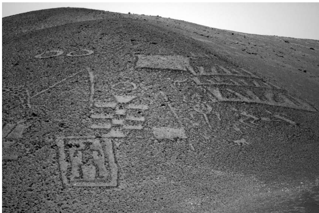
Figura 6. Panel de geoglifos. Cerro Mono – Provincia del Tamarugal. Panel of geoglifos; Pretty Hill – Province of the Tamarugal.

allá de la cordillera. Los modelos adquieren sus variables regionales y locales como lo vemos en toda forma de expresión humana. La tradición también cruza transversalmente diferentes desarrollos de la