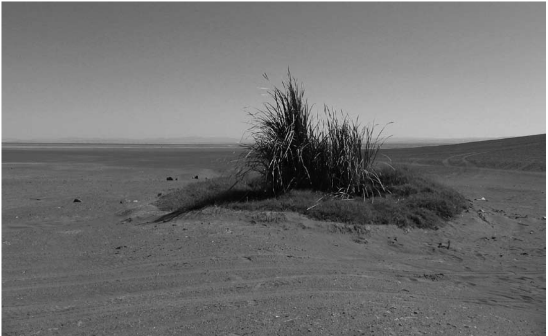
Figura 1. Imagen de paisaje: “Ojo de agua” Puquio Núñez – Comuna de Pica.

Image of landscape: “Water eye” Puquio Núñez – Commune of Pica.